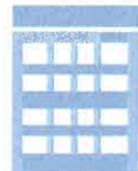
年金事務所・ 市区町村の年金窓口